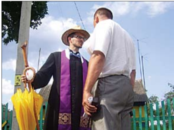
А вы чаго з ракавінай? Ксёндз размаўляе з чалавекам у цывільным.