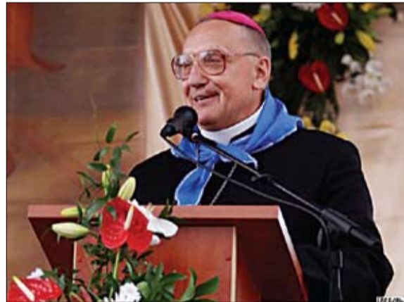
Вернікаў вітае шчаслівы за іх мітрапаліт.