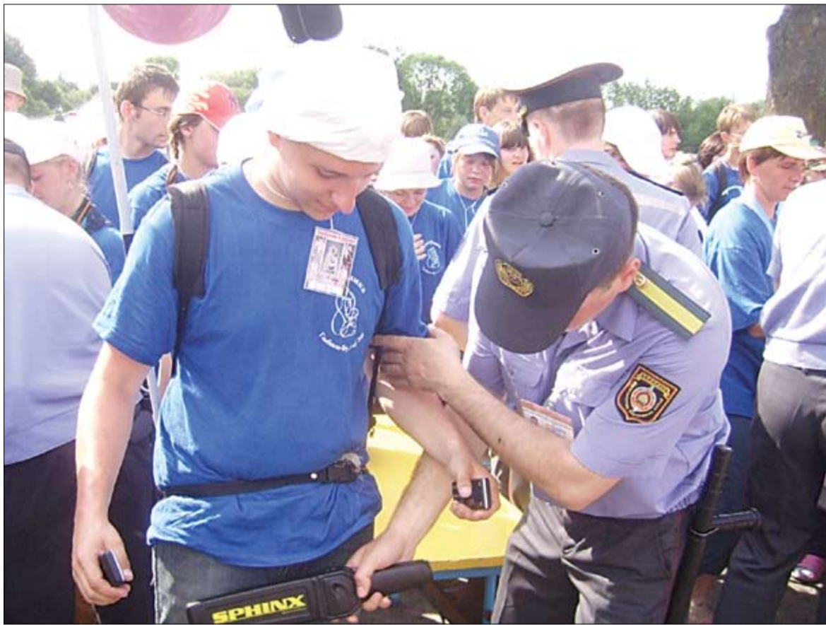
Там у вас што? На ўваходах у мястэчка пілігрымаў абшуквалі, як у аэрапорце.

Адзін з тыповых інцыдэнтаў дня — у распаўсюдніка часопіса «ARCHE» на турнікеце сканфіскавалі 9 асобнікаў кнігі «Беларуская навуковая тэрміналогія» і адрэўныя талоны-чэкі для разнаснага гандлю. Віна гэтай кнігі была хіба што ў таўшчыні і беларус-