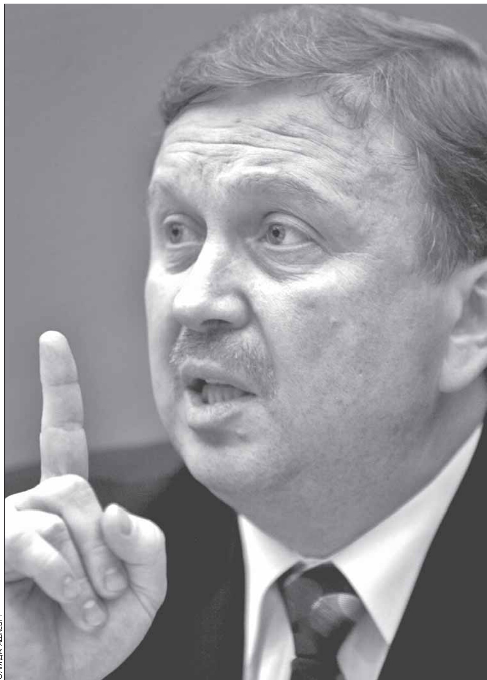
Намеснік прэм'ер-міністра Андрэй Кабякоў.

За першыя 20 дзён году золатавалютныя рэзервы Беларусі скараціліся на $900 млн.