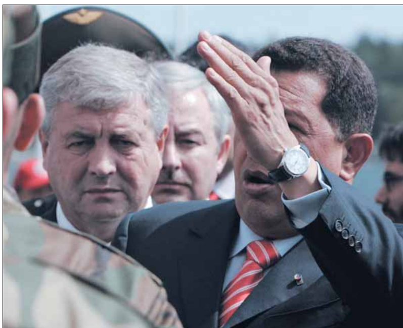
ЗП Цяпер Шэйман на задніх ролях.

Нагадаем, што Віктар Шэйман з'яўляецца падазраваным у знікненні апанентаў улады. За гэта ён фігуруе ў спісах невыязных беларускіх чыноўнікаў у краіны Еўрасаюзу і ЗША. Пасады старшыні Рады Бяспекі пазбавіўся пасля выбуху ў Мінску на Дзень Рэспублікі. На адмысловай нарадзе па выбуху Лукашэнка заявіў Шэйману: «Вы вінаватыя».