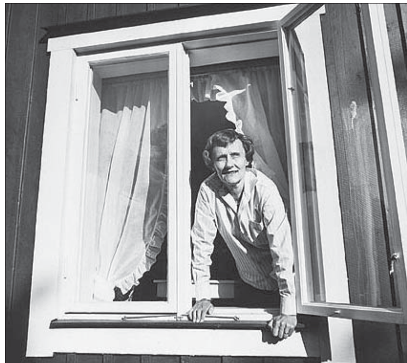
На здымку Ганны Рыўкін Астрыд Ліндгрэн.