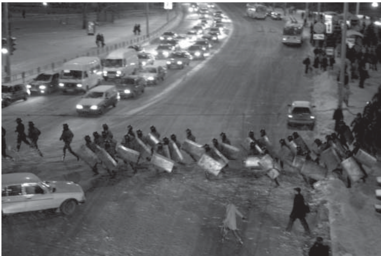
Менск, Няміга. 2 сакавіка.