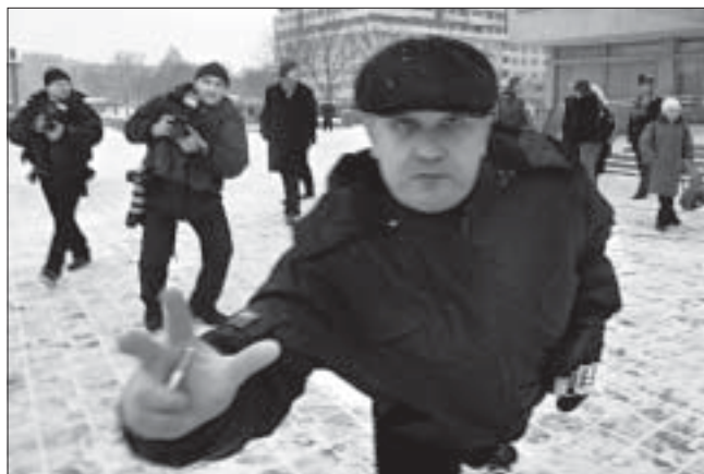
Невядомы ў цывільным перашкаджае фотакарэспандэнту здымаць інцэдэнт з Аляксандрам Казуліным ля менскага Палацу чыгуначнікаў 2 сакавіка.