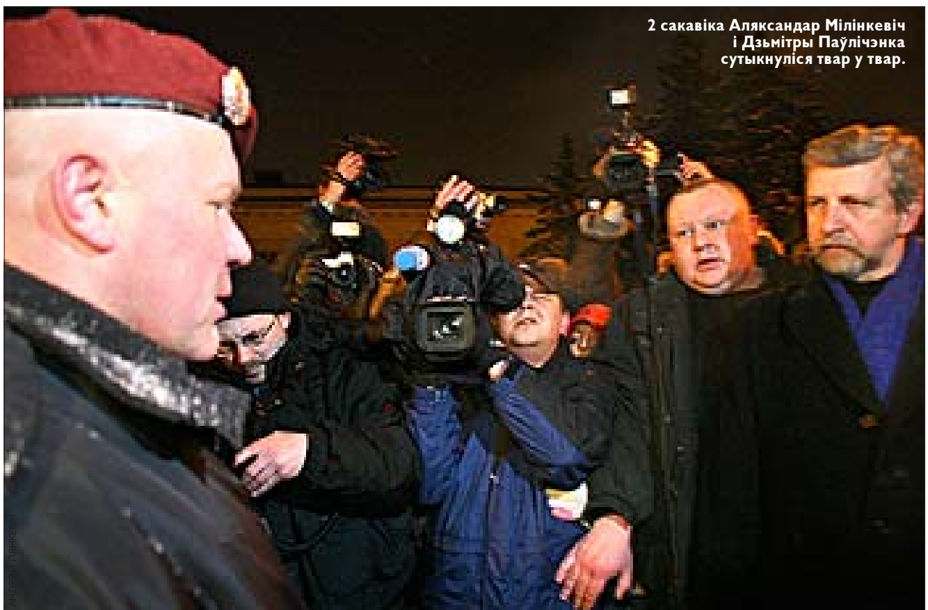
2 сакавіка Аляксандар Мілінкевіч і Дзьмітры Паўлічэнка сутыкнуліся твар у твар.

У нумары: фатахроніка 2 сакавіка. А таксама: як робяцца правакацыі — старонка 8.