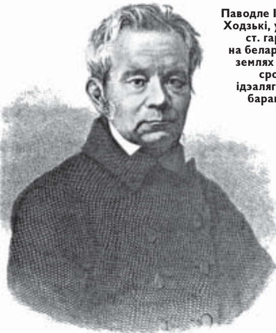
Паводле Ігнаці Ходзькі, у XIX ст. гарбата на беларускіх землях была сродкам ідэалігічнай барацьбы.

Апроч таго, сур'ёзным апанэнтам гарбаты выступала кава. Колісь таксама сустрагала ў Рэчы Паспалітай не без забабонаў і клінаў (бо мода на яе прыйшла ад найгоршых ворагаў — туркаў), да пачатку эпохі падзелаў кава пасьпела