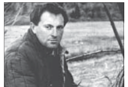
Ёсіф Бродзкі, высланы «за тунелядства» ў Архангельскую вобласьць.

Там, на кончыку голкі, хапае месца толькі для аднаго, дык няхай ён лепей будзе старым, бо старыя не прыкідваюцца анёламі. Адзіная задача старэючага тырана — утрымаць сваё становішча, ягонае дэмагогія і крывадушша не прыгнятаюць розумы падданных неабходнасьцю ў іх верыць альбо тэкстуальнай разнастайнасьцю; у той час як малады выскачка зь яго сапраўднай альбо паказной рушлівасьцю і мэтанакірава