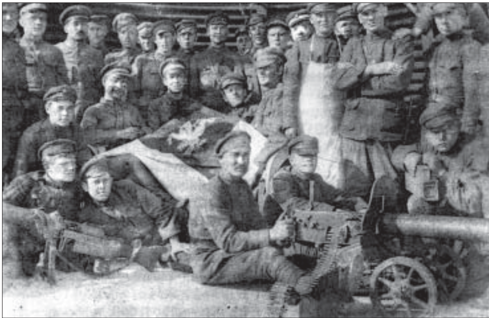
Жаўнеры самастойнага беларускага атраду літоўскага войска (1919). Многія зь іх папоўняць сабою партызанскія аддзелы.

Найбольш значнай акцыяй, якая прымусіла ўрад Польшчы звярнуцца да пытання кантролю над паўночна-ўсходнімі крэсамі, быў захоп Стоўпцаў. А 2.30 ночы 4 жніўня 1924 г. аддзел у 100 чалавек увайшоў у павятовую горад і атакаваў дзяржаўныя ўстановы. Апэрацыя была праведзена бліскуча — перад нападам адключана сувязь, перакрыты пад'язныя шляхі. Пасьля нападу асноўная частка ўдзельнікаў пераправілася за савецкую мяжу. Кіраваў апэрацыяй Кірыла Арлоўскі, той самы Муха-Міхальскі. Той Арлоўскі, які пасьля II сусьветнай на сваёй радзіме ў Кіраўскім раёне, карыстаючыся дзяржаўнымі прэфэрэнцыямі, створыць узорную шматгаліновую савецкую гаспадарку — калгас «Расвет».