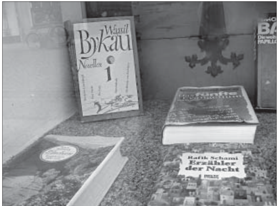
Эўропа сочыць за Беларусіяй. Кнігарні Franke ў Вітэнбэргу (Нямеччына) выставілі на вітрыву Быкава .

Новы імпульс акцыі дадае ўдзел у ёй вядомых асобаў. 16 лютага за-