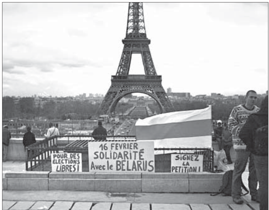
Акцыя салідарнасьці ў Парыжы.

палілі ў сваіх вокнах сьвечкі Вацлаў Гавал ды многія іншыя эўрапейскія палітыкі — і гэта найлепшая падтрымка тым беларусам, хто, запальваючы сьвечку перад шыбаю, спадзяецца пабачыць агеньчыкі ў вокнах аднадумцаў, аднак заўважае там толькі сьвятло тэлеэкранаў.