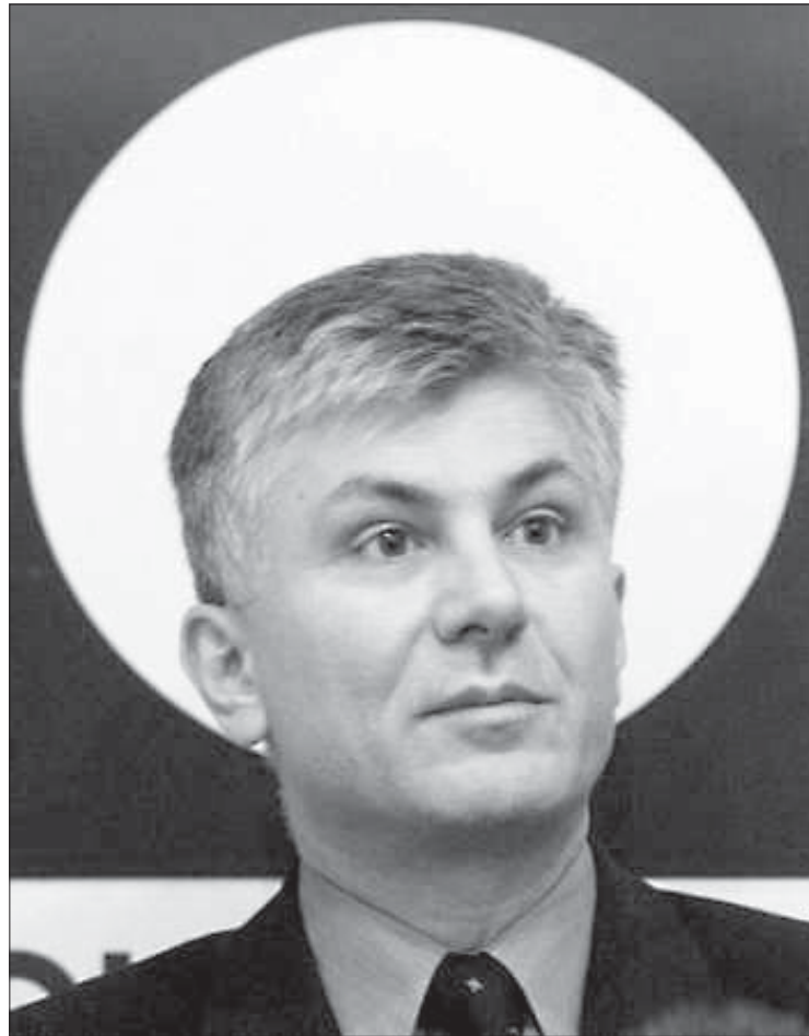
Джындыжыч меў сяброў ня толькі ў «раі», але і ў «пекле». Ён загінуў, калі паспрабаваў разарваць дамову з «д'яблам».