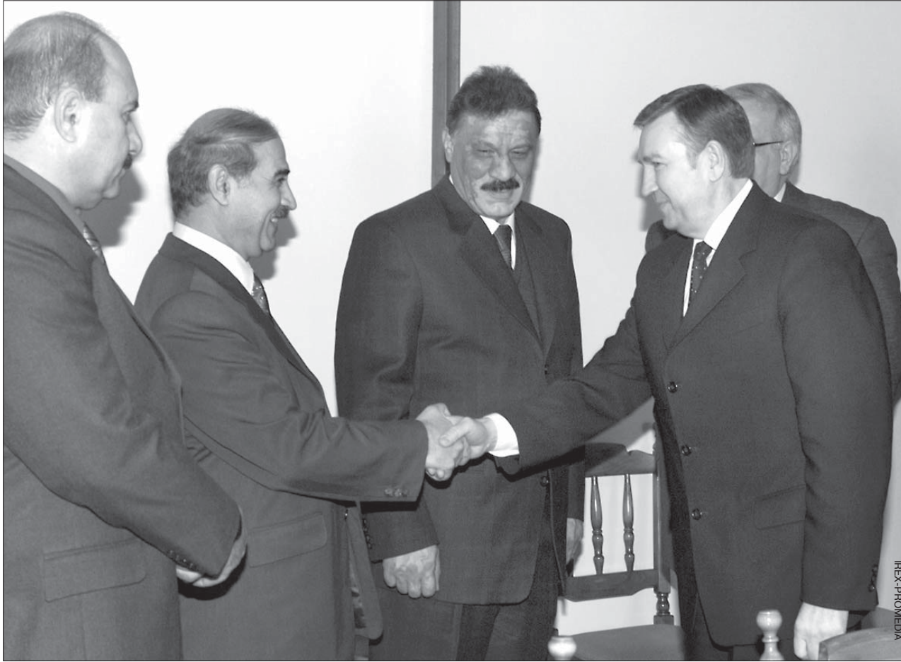
Беларускі бок хвалюе лёс экспертных кантрактаў з Іракам, а таксама абяцання інвестыцыі з арабскіх фондаў.