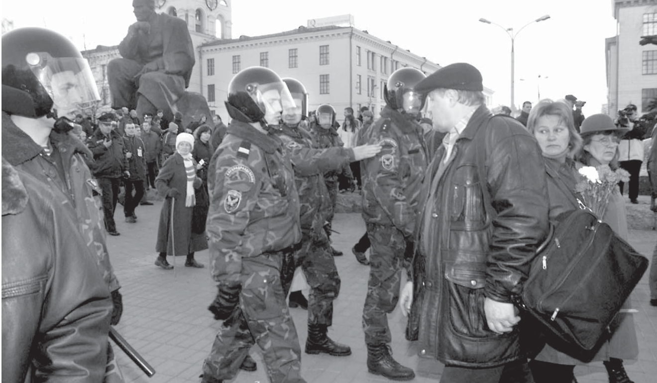
25 сакавіка плошчу Якуба Коласа «ачысьцілі» нейкія два дзясяткі амапаўцаў...

Сёлетні Дзень Волі прайшоў як ніколі сьціпла. Нацыянальныя сілы не змаглі дамовіцца ды зладзіць у Менску супольныя акцыі. Партыйных правадыроў памірылі ўлады: лідэры фракцый-канкурэнтак трапілі за адны краты.