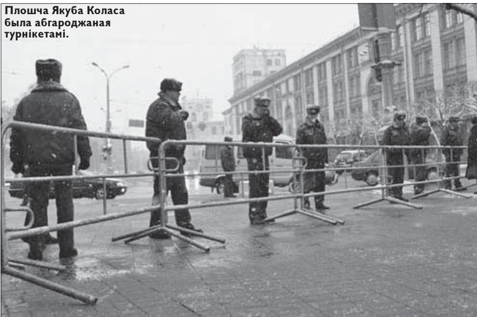
Плошча Якуба Коласа была абгароджаная турнікетамі.

Спэцназ зноў пашыхтаваўся ўздоўж праспэctu, але разганяць акцыю ня сталі. Адно перапынялі спробы працягнуць шэсьце — каля 500 чалавек спрабавалі прарвацца да Нацыянальнай бібліятэкі. Прыкладна а 20.00 дэманстрантаў канчаткова загналі ў мэтро. Нехта паехаў сьвяткаваць Дзень Волі дадому, іншыя — чакаць сяброў і паплечнікаў да РУУСаў.