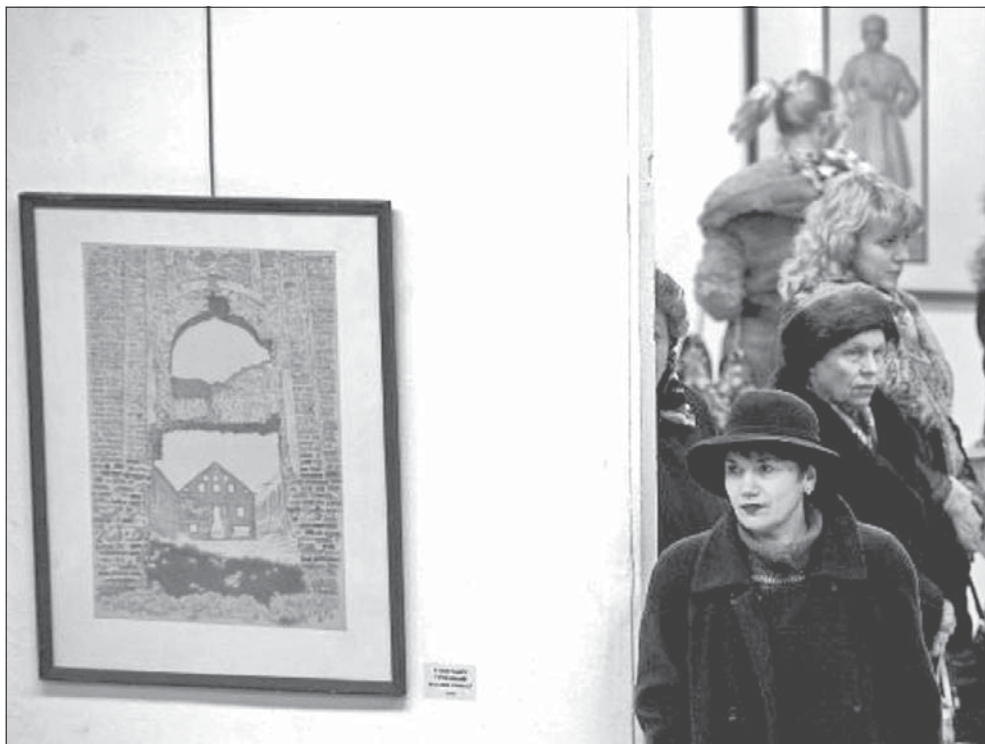
19 сакавіка ў менскім Палацы мастацтваў (вул. Казлова, 3) адчынілася выстава твораў слаўтага беларускага мастака-графіка, аўтара эталёну герба «Пагоня» Яўгена Куліка (1937–2002).