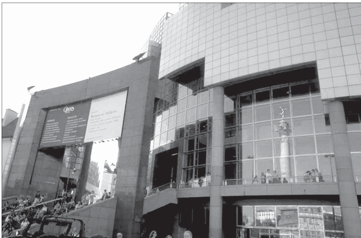
Парыская «Opera Bastille» штомесяц дае 14 спэтакляў з удзелам найлепшых сьпевакоў Эўропы.

І Дзяржаўная опэра, і «Komische Oper» некалькі дзесяцігодзьдзяў