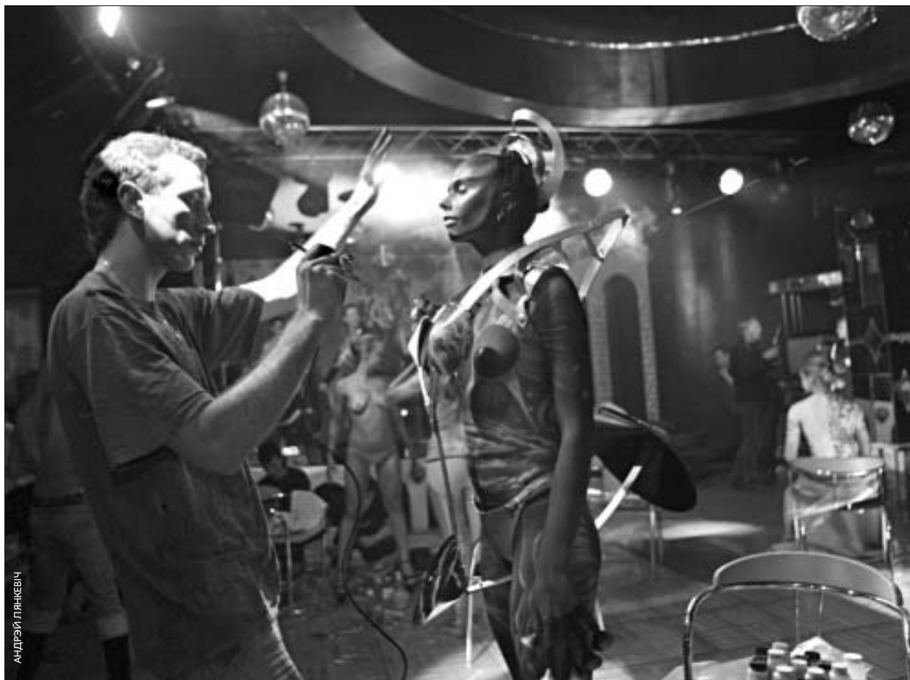
Конкурс бодзі-арту падчас фэстывалю авангарднай моды «Мамант-2005» у Менску 26 траўня.