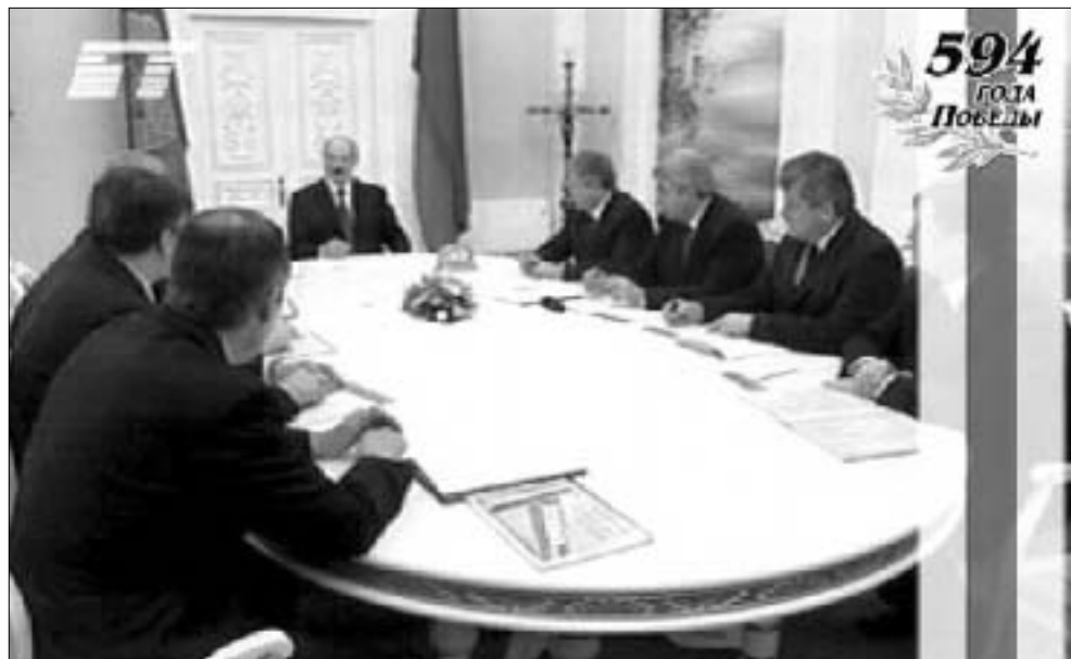
Тэлэрэчаіснасьць, створаная галоўным героем фільму: абвяшчэньне бел-чырвона-белага сьцяга «Штандарам Перамогі» з нагоды 594-годзьдзя Грунвальду.

Заля, што была забітая да адказу, выбухала рогатам не аднойчы. «Гудбай, бацька, гудбай!» Сьмеючыся, мы разьвіталіся з сваёй цяпершчынай.