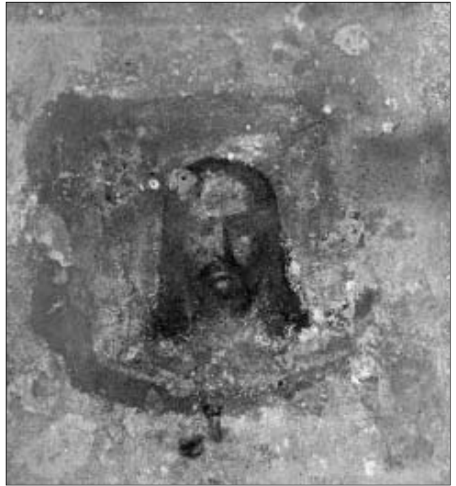
Нерукатворны абраз праступае праз тынк.

князя Лугвена, пераабсталяваўшы Раствабагародзіцкую царкву, што пад стромым пагоркам манастырскаяй плошчы. Але неўзабаве быў «сыгнал» «куды трэба», і аматараў парыцца ў царкоўных мурах пакаралі. А заадно — раскідалі дашчэнтку саму сьвятыню, з-пад якое цурчэла крыніца.