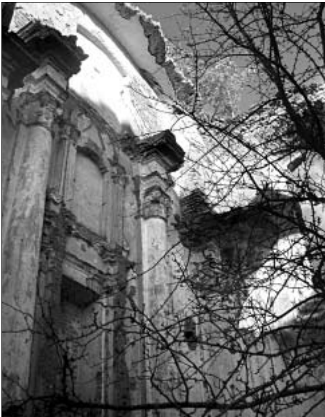
Руіны Ёсьпенскага сабору. Сакавітая ракайльная плястыка галоўнага аўтара даўно служыць адно дзікім птахам.

Недзе ў 1970-я гады мясцовае начальства абсталывала тут сабе шыкоўную лазню на сьвятой крыніцы