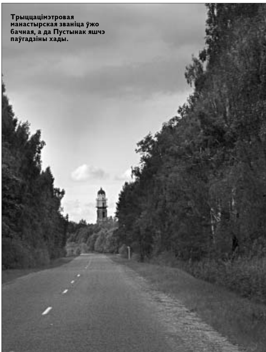
Трыццацімэтровая манастырская званіца ўжо бачная, а да Пустынак яшчэ паўгадзіны хадзі.

Дзякуючы шматлікім цудам выдараўленьня пры сьвятой крыніцы гэты прыстанак меў шчодрыя фондушы. Ужо ў XV ст. манастыр славіўся сваім багацьцем. Падчас Лівонскае вайны, у 1560 годзе, Сьвятасьпенскі манастыр разрабавала й спаліла маскоўскае войска. У 1578 годзе кароль Сьцяпан Батура шчодро абдарыў сьвятыню й перадаў манастыр по-