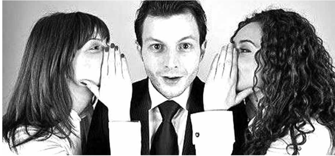
Усе годныя, прыязныя і прыгожыя беларускі цудоўна ведаюць мову і ахвотна на яе пераходзяць.

Хіба толькі ў тым, што іх цяжэй адпрэчыць, і, магчыма, у вашай большай залежнасці ад іх. Добра, калі вы ўжо жывяце асобным ад бацькоў жыццём. У такім выпадку нават пры ўзнікненні канфлікту наўрад ці вам гэта пагражае нечым істотным. Вашыя прынцыпы, вашыя мэты жыцця, ваш духоўны