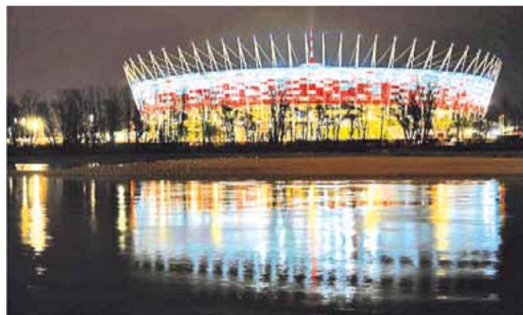
Варшаўскі стадыён паўстаў на беразе Віслы.