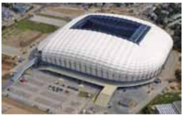
Стадыён у Познані афарбаваны «ў натуральны колер шоўку».

Ва Украіне яшчэ да абвяшчэння месца правядзення «Еўра» вя-