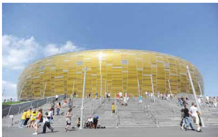
Гданьская арэна нагадвае вялікі бурштын.

лося будаўніцтва адной з неабходных арэн. Гаворка, вядома, пра данецкую «Данбас-Арэну».