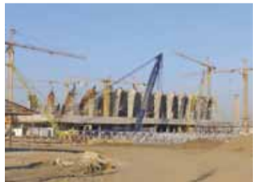
«Арэна Львiв» будавалася даўжэй за астатнія стадыёны.