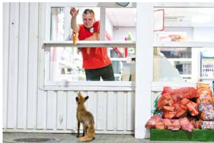
Ліса стала пастаянным кліентам бензакалонкі ў Літве. Калі ежы замала, то жывёлінка ідзе да канкуруючай АЗС.