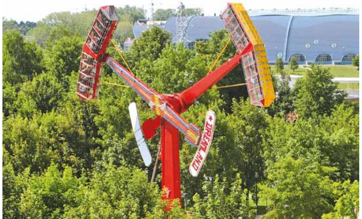
18-метровы экстрэмальны атракцыён у парку «Дрымлэнд».