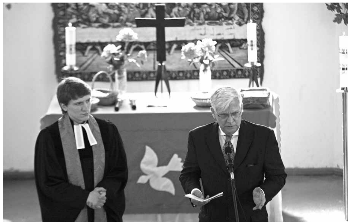
Пастар Татарнікаў і пасол Вайль падчас урачыстасці.

Юрась Ускоў Матэрыял зроблены пры садзейнічэнні Пасольства Федэратыўнай Рэспублікі Германія