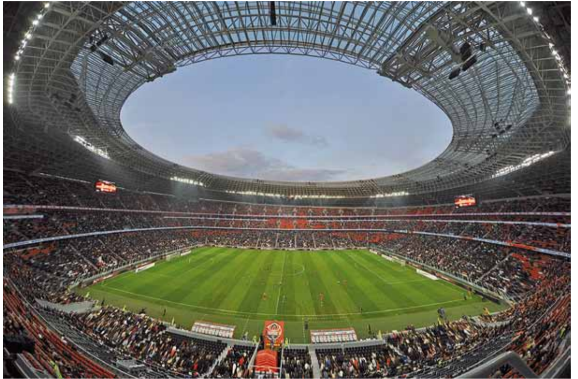
«Данбас-Арэну» ўзвялі яшчэ да пачатку «Еўра».

Дзюсельдорфскае архітэктурнае бюро Rhode-Kellermann-Wawrowsky прапанавала ў якасці асноўнай мастацкай