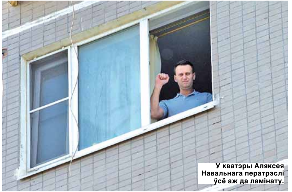
У кватэры Аляксея Навальнага ператрэслі ўсё аж да ламінацыі.