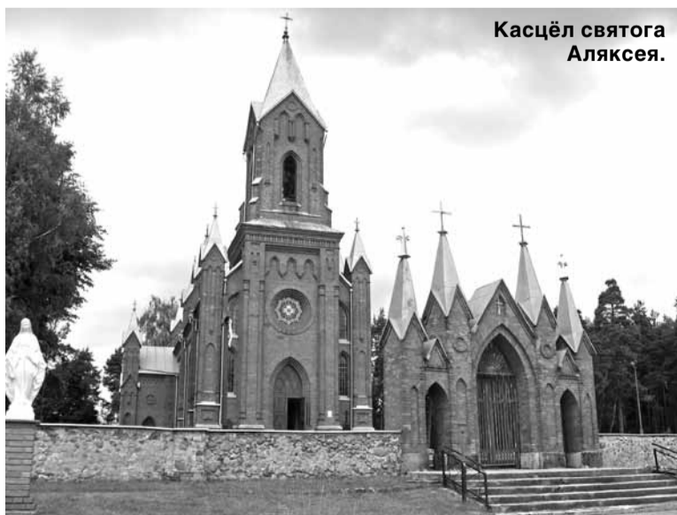
Касцёл святога Аляксея.

Падарожжа можна прыверкаваць да Цукеркавага фэсту ў Івянцы, які адбудзецца 16 чэрвеня. Падчас яго адбудзецца тэатральнае прадстаўленне, рыцарскія бойкі, пошукі скарбу і, вядома ж, дэгустацыя цукерак мясцовай вытворчасці. Пачатак а 14-й на плошчы Свабоды ў Івянцы.