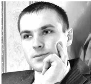
У Змітра засталася маладая жонка.