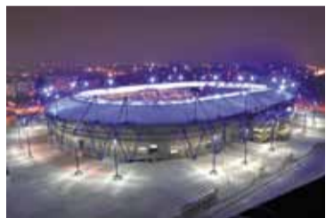
Харкаўскі стадыён яшчэ называюць «Павуком».