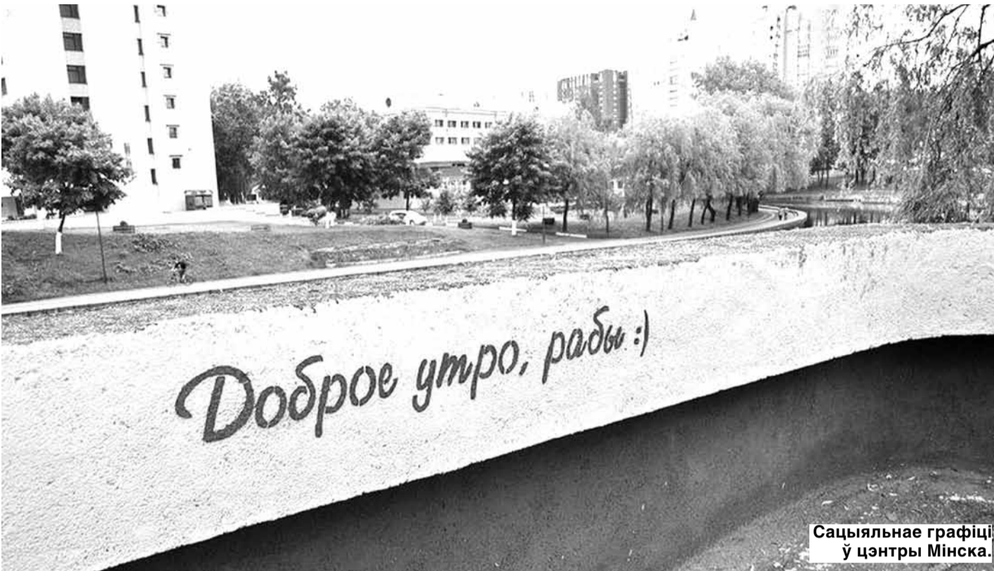
Сацыяльнае графіці ў цэнтры Мінска.