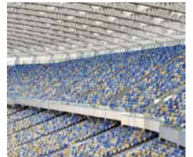
«Алімпійскі» ў Кіеве: індывідуальнымі сядзеннямі фармуецца абстрактная мазаіка ў колерах нацыянальнага сцяга Украіны.

тэмы для арэны ў партовым Гданьску вобраз бурштыну, якім славіцца Балтыйскае мора.