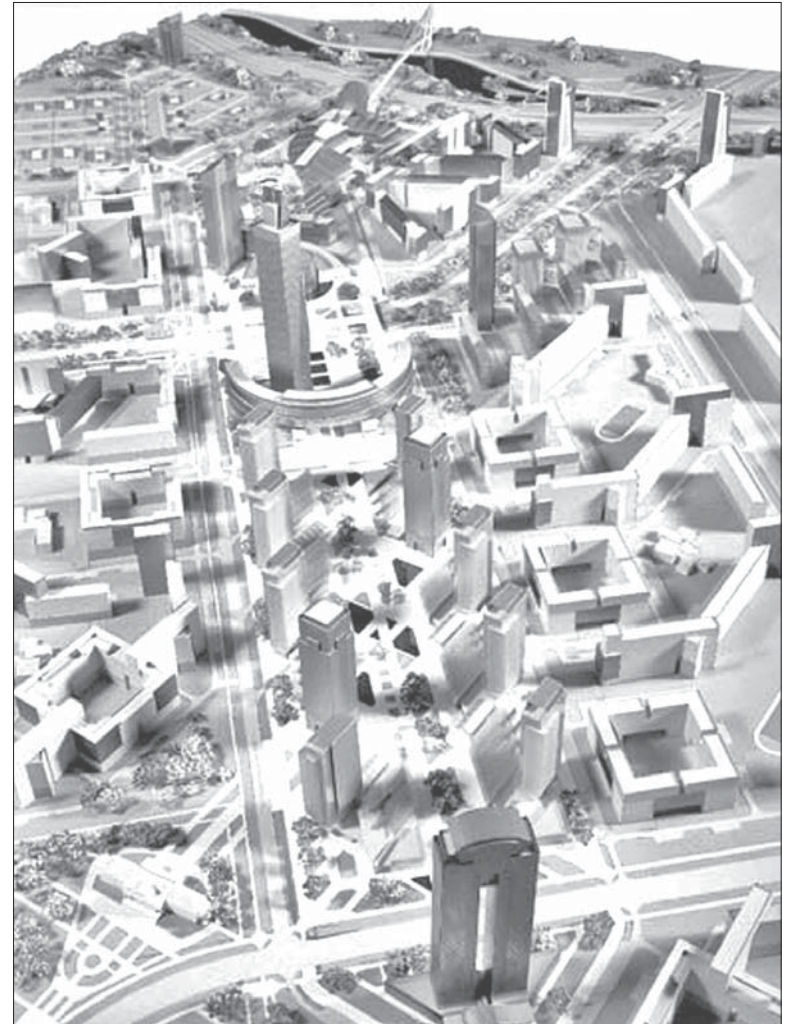
Да 2020 г. на месцы аэрапорту «Менск-1» паўстане міні-горад з насельніцтвам 55—60 тыс. чалавек.

Кіраўніцтва праекту пабудовы бізнэс-цэнтру на Танка запэўніваюць, што ён улічвае інтарэсы мясцовых жыхароў, не сапсуе выгляд гэтага раёну гораду і экалягічнае становішча. Аднак жыхары раёну ня згодныя з гэтым меркаваньнем. Пра тое ў траўні напісала газэта «Звязда». Люд-