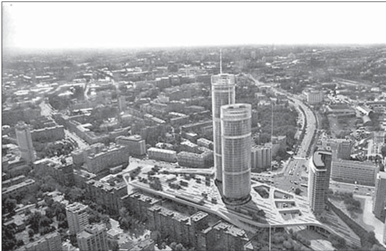
Бізнэс-цэнтар паміж вуліцамі М.Танка і Кальварыйскай будзе складацца з 30-павярховага жылога дому і двух будынкаў вышыняй 43 і 54 паверхі.

Пабудова «Менск-Сіці» мае каштаваць $4,8 млрд.