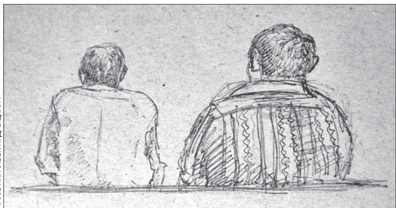
МАЛЮНКІ АЛЕСЯ КУДРЫЦКАГА