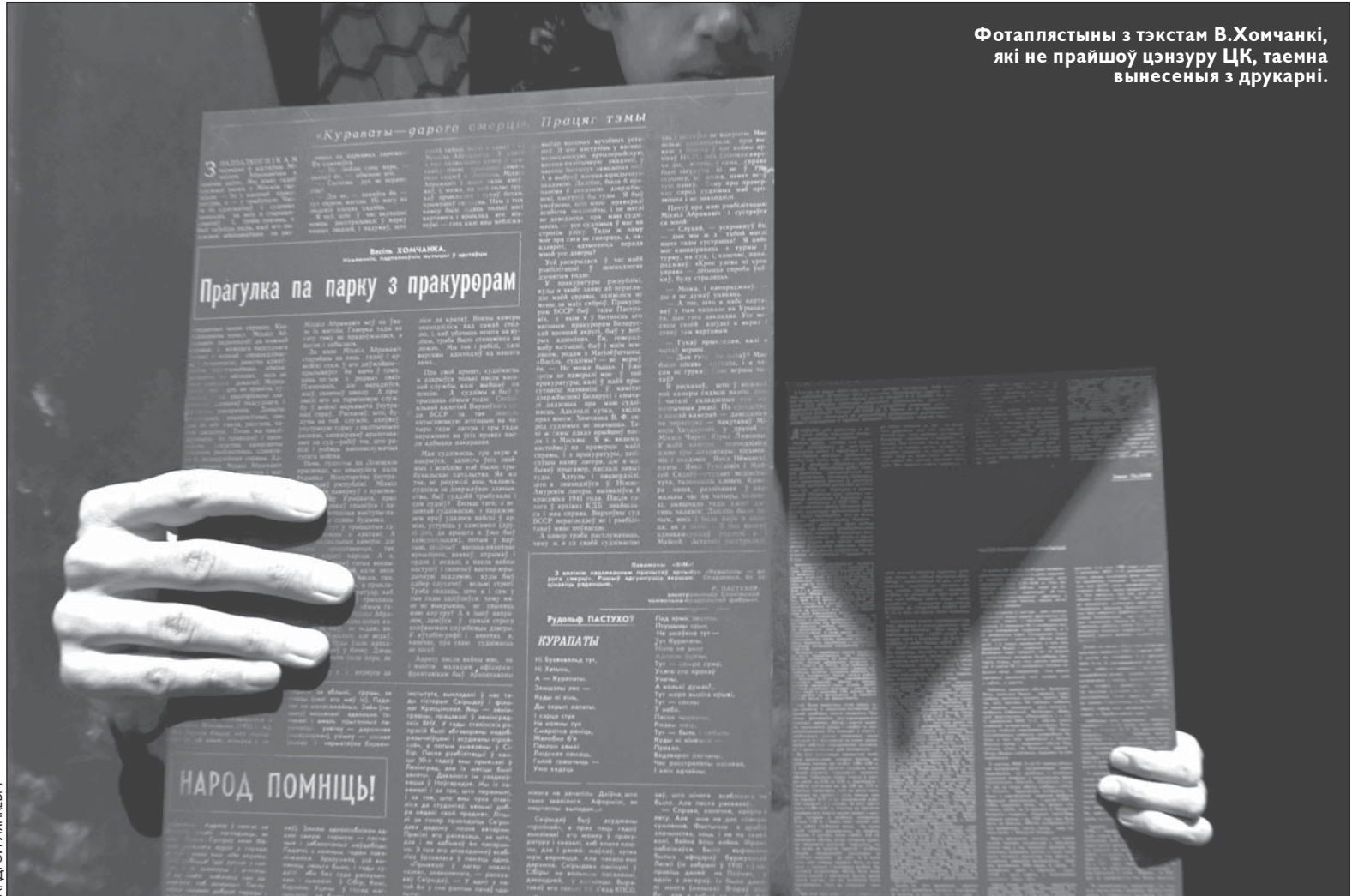
Фоталістыны з тэкстам В.Хомчанкі, які не прайшоў цензуру ЦК, таемна вынесены з друкарні.