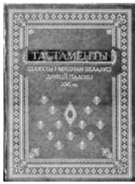
Тастаменты шляхты і мяшчан Беларусі другой паловы XVI ст. — Мінск: «Беларуская энцыклапедыя», 2012. На 700 аркушах — 116 тастаментаў, слоўнік актавай мовы, асабовы і геаграфічны паказнікі.