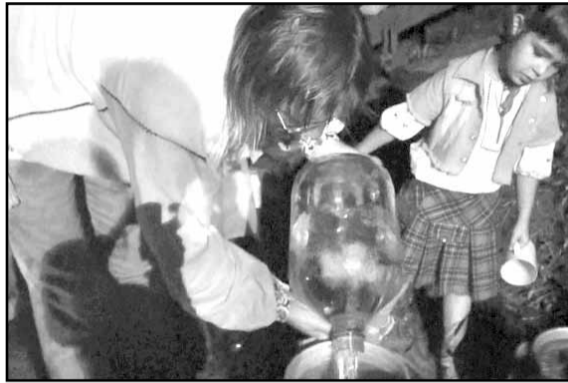
Журналісты «НН» здымалі на відэа Купалле ў Бабры. У кадр трапіў і момант выбуху.

У выніку тыя, хто стаяў побач, успыхнулі як запалкі. Нехта паваліўся з абрыву, на якім і гатавалі крупнік. Хто не пацярпеў, адразу кінуўся ратаваць іншых. У бальніцу ў Крупкі забралі пя-