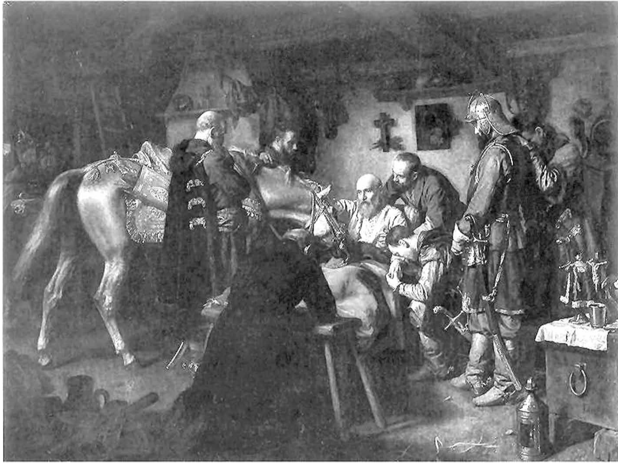
Леапольд Лёфлер. Смерць Стэфана Чарнецкага. 1860.

Тастаменты пісаў кожны, ці то у радасцях і раскошах, ці то згалоцаны і нічога не ма-