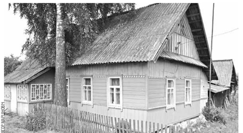
Хата Шакуціна ў Вялікім Бабіне нічым не вылучаецца на фоне суседскіх.

І тут у кар'еры Шакуціна адбываецца рэзкі ўздым. «Пасля заканчэння ардынатуры медыцынскага працаваў загадчыкам хірургічнага аддзялення 10-й мінскай бальніцы», — гаворыцца ў ягонай біяграфіі. «Я прайшоў шлях ад доктара... да дырэктара медыцынскага цэнтра МТЗ, які я ствараў з нуля», — хваліўся ён «Камсамолцы».