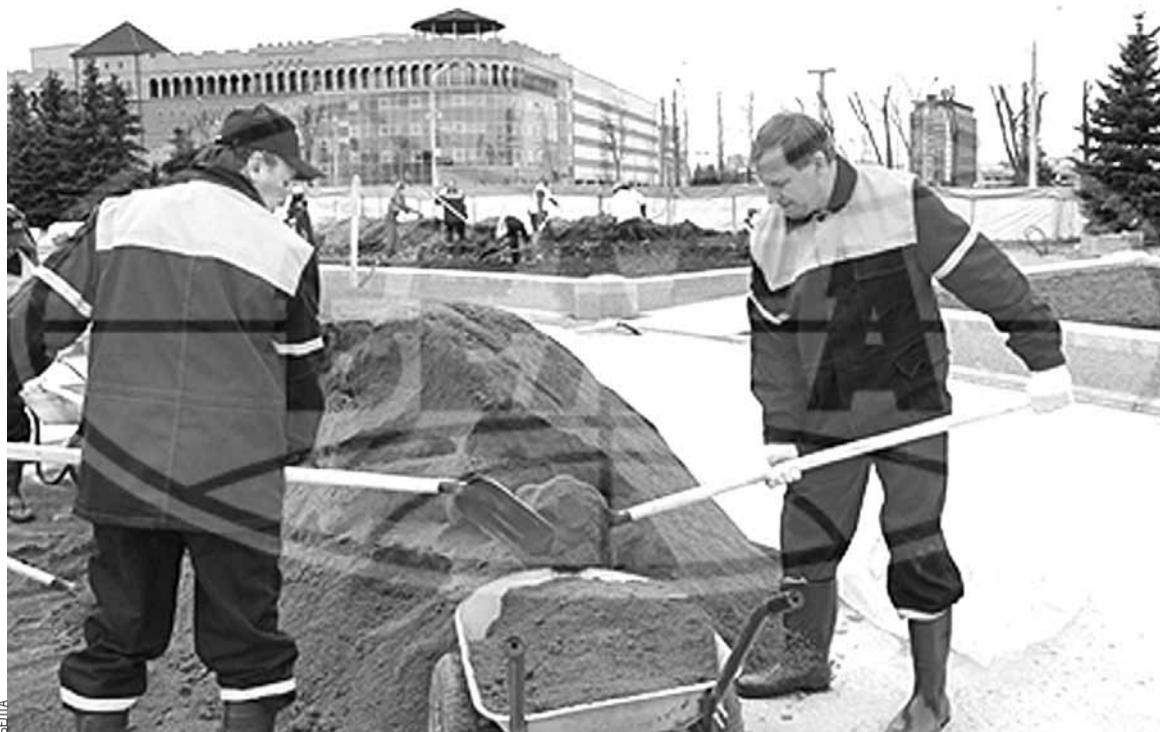
Працаваць на суботніку побач з Лукашэнкам перспектыўна для прыватнага бізнэсу.

Завод пачаў падрыхтоўку да акцыянавання яшчэ да развалу СССР. Калі ўтварылася незалежная Беларусь, рэвізійная камісія пераацаніла актывы «Амкадора». Акцыі падаражэлі больш чым на 20%. Неўзабаве правяраючыя прыйшлі зноў: нібыта былі няправільна выкарыстаныя чэкі «Маёмасць» на выкуп акцый. «Амкадор» здолеў адстаяць у су-