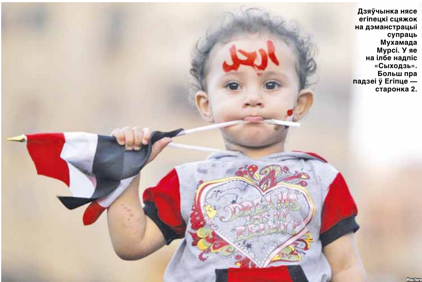
Дзяўчынка нясе егіпецкі сцяжок на дэманстрацыі супраць Мухамада Мурсі. У яе на ілбе надпіс «Сыходзь». Больш пра падзеі ў Егіпце — старонка 2.

*** Учора тата змяніў мой профіль ў тэлефоннай кніжцы. Раней быў «дачушка», а цяпер — «тата, дай грошай!» *** — Даражэнькі, давай сёння не будзем засперагацца... — Блін, Язэпавіч, ты задзеўб! Бяры каску, мы ж на будоўлі ўсё ж такі! *** Хлопчык з надзвычай ціхім голасам ведае назвы ўсіх канцавых прыпынкаў маршрутку. *** Да дзяцей камуністаў прылятае Карлсан Маркс. *** Прэм'ера балета «Лебядзінае возера» ў раённым цэнтры культуры была сарваная хуліганамі, якія падчас першай дзеі пакрышылі на сцэну батон. *** Пенсіянерка Марыя Іванаўна памыла швэдар белым парашком, знойдзеным у пакоі ўнучка. Швэдар сеў, а дарагі ўнучак — не. *** Калі вас пакусаў злы сабака, не перажывайце. Некалі пакусае і добры. *** Тэарыст захапіў заалагічны магазін: — У вас ёсць 30 секундаў, каб пакінуць пам'яшканне! Чарапахы: — Сволач!