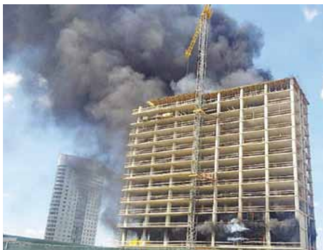
У Мінску гарэла будоўля бізнэс-цэнтра і гасцініцы Юрыя Чыжа «Green City». Праўда, агонь хутка згасілі.