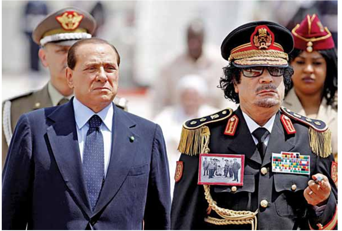
Сям'я Кадафі знайшлася ў Алжыры

У аўторак улады Алжыра пацвердзілі, што афіцыйная жонка Кадафі Сафія, ягоная дачка Айша і сыны Ганібал і Мухамед знаходзяцца на тэрыторыі гэтай краіны.