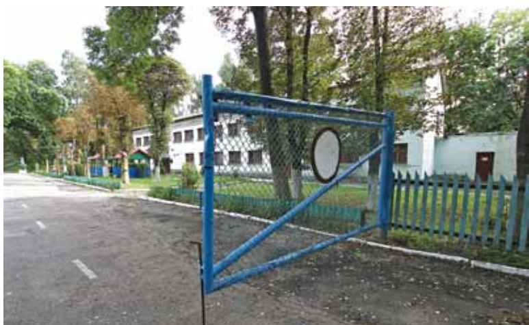
Былая афіцэрская казарма стала камандатурай для «хімікаў».

Севярынца адпускаюць паразмаўляць з намі ў алыганку. Дзве такія стаяць перад камандатурай. За алыганкамі выдзецца відэаназіранне. Адно выкарыстоўваюць для наведвальнікаў, у іншай паркуюць ровары. Тут іх няма. Большасць «хімікаў» працуюць у Пружанах. У Севярынца свой ровар таксама маець