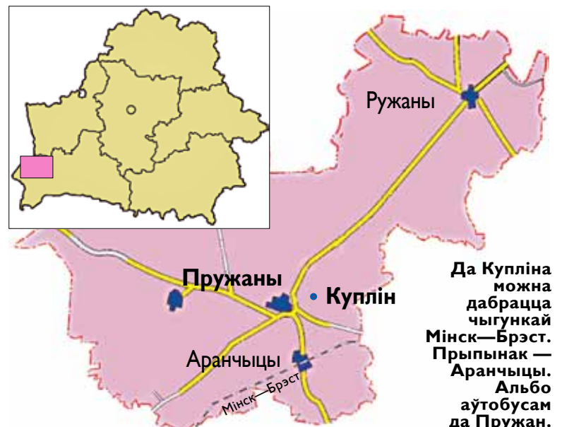
Да Купліна можна дабрацца чыгункай Мінск—Брэст. Прыпынак — Аранчыцы. Альбо аўтобусам да Пружан.