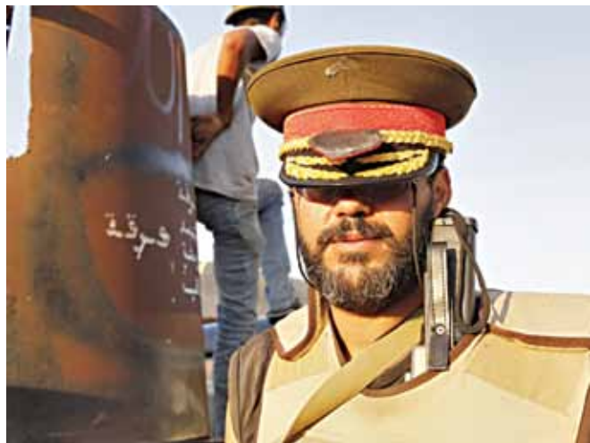
Фотафакт: паўстанец пазуе ў фуражцы галоўнакамандуючага Кадафі. «Я падару гэтую фуражку свайму тату. Ён так пацярпеў ад рэжыму Кадафі, — сказаў паўстанец фотарэпарцёрам. — Я знайшоў яе ў спалні Кадафі. Я пабачыў яе і падумаў: божа, гэта ж фуражка, у якой ён прымаў парад». 22 жніўня паўстанцы штурмам узялі ўмацаваны квартал-рэзідэнцыю лівійскага лідара. Той уцёк — праз падземны тунэль.

Пакуль няясна, дзе знаходзіцца сам Муамар і ягоныя сыны Сэйф уль-Іслам і Хаміс, якія кіравалі сілавымі структурамі.