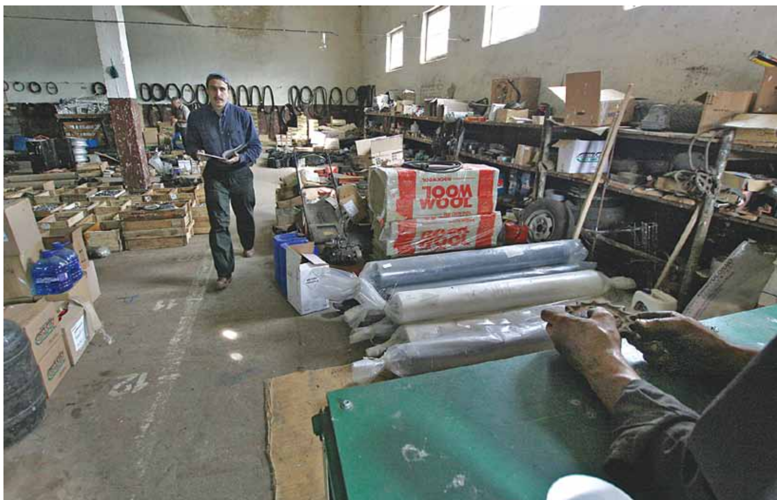
Севярынец на працоўным месцы, у ягоныя абавязкі ўваходзіць улік і выдача запчастак.

Купліне вялікі голод на гістарычную літаратуру.