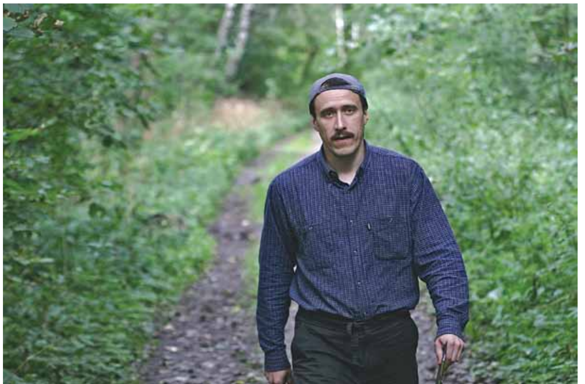
Севярынец: «Палову шляху да свабоды мы ўжо прайшлі».