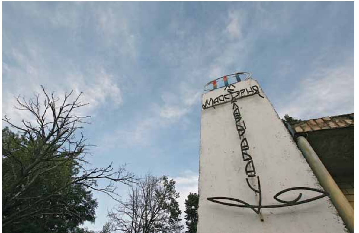
Кавальня з беларускамоўнай шыльдай стаіць на ўездзе ў Куплін.