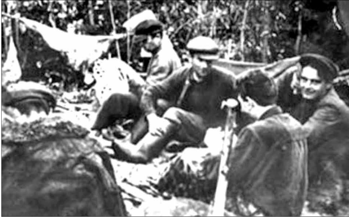
Адзін з рэдкіх здымкаў беларускіх павянных партызанаў. Група Філіс-товіча, Ільянскі раён, 1952 год.

Вось што аўтары 1950-х пісалі пра працэс «Саюза вызвалення Беларусі» 1930 г.: «У 1926 годзе на тэрыторыі БССР нацыяналісты стварылі антысавецкую паўстанцкую арганізацыю з цэнтрам у Мінску... Яна мела філіялы ў Віцебску, Полацку і іншых гарадах Беларускай ССР. Для пашырэння анты-