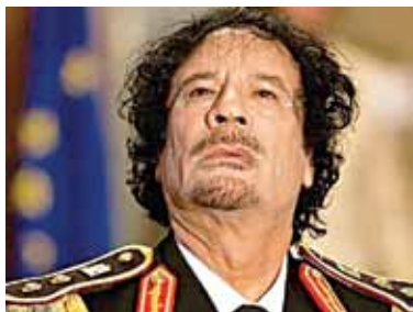
Павучальная гісторыя Муамара Кадافی. Старонка 3.